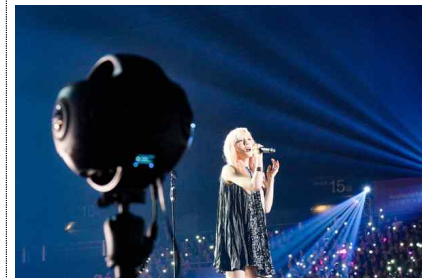
[ Insta360 TITAN, 1대]