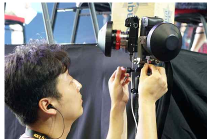
[Entaniya Fisheye HAL 250 3.0 Lense, 3개]